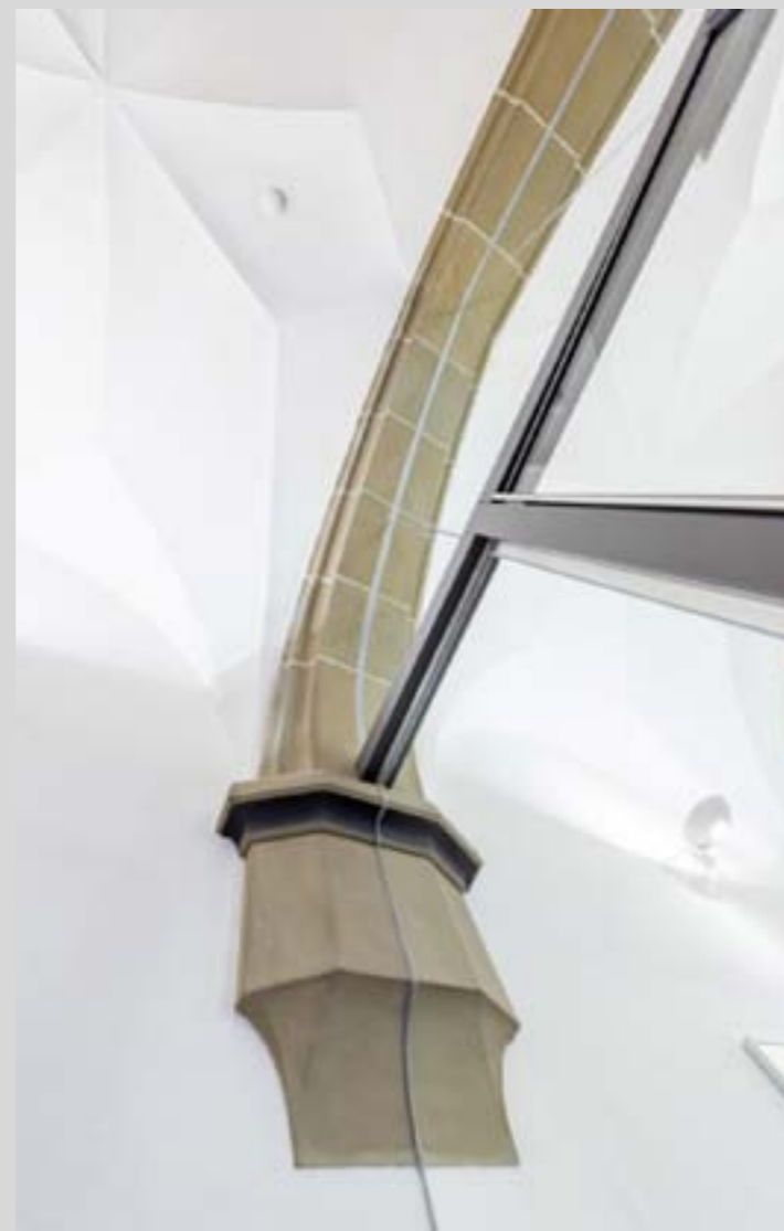
RS-Elemente mit Laserschnitt am Bestand angepasst

Planung und Ausführung geschah in enger Zusammenarbeit mit der Feuerwehr Trier, Dem Amt für Denkmalpflege und dem GUV. Neben Brandschutztechnischen Umbauten, wie dem Einbau von Rauchabschlüssen im historischen Treppenhaus waren vielerlei Auflagen der Unfallkasse zu beachten.