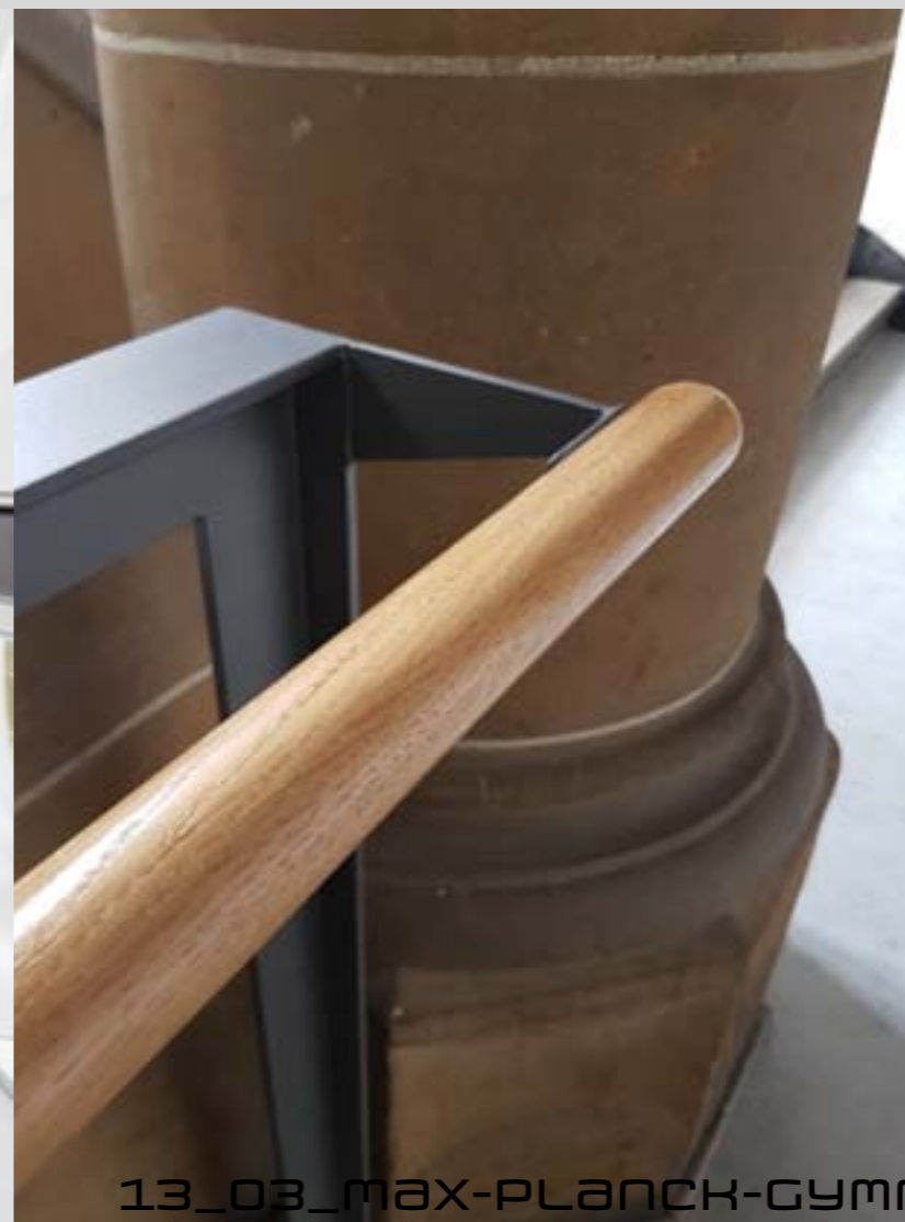
Absturzsicherungen im historischen Bestand

Das MPG ist eines von mehreren denkmalgeschützten Gebäuden welche durch das Büro Stüber saniert wurden. Bauen im denkmalgeschützten Bestand gehört mittlerweile zu den Kernkompetenzen des Büros Stüber