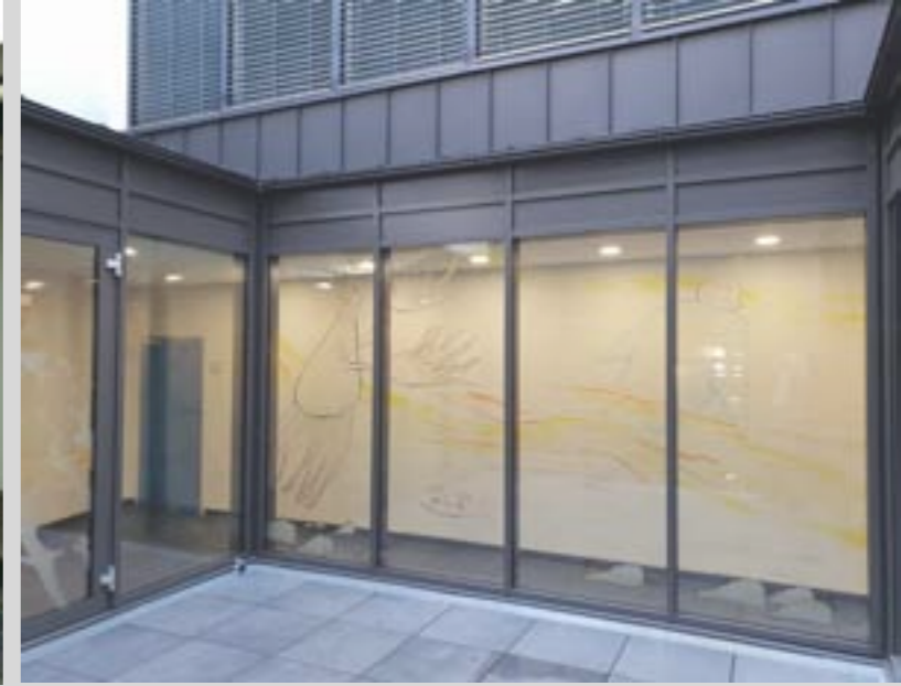
Neugestaltung des Lichthofes des MPG

Das denkmalgeschützte Gebäude des Max-Planck-Gymnasiums Trier ist eine der ältesten weiterführenden Schulen der Stadt. Der Altbau aus dem Jahr 1914 wurde in den 1970er Jahren um einen Neubau ergänzt und 1991 aufgestockt. Ein durchgängiges Brandschutzkonzept der Gebäude wurde 2014 erstellt. Die passende HU-BAU wurde durch das Büro Stüber erstellt und gemeinsam mit der Gebäudewirtschaft, SGD Nord und der ADD ausgearbeitet. Die klare Struktur unserer HU-Bau in Form einer Kostenaufstellung nach DIN 276 und eines RGB mit korrespondierenden Kosten wurde von den Förderstellen ausdrücklich gelobt und führte zu einer erheblich schnelleren Bearbeitung der Anträge.